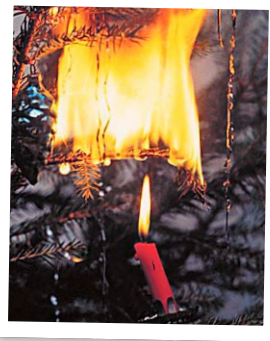
Brennen schnell Alte Tannennadeln.