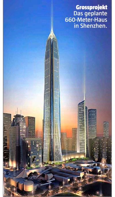
Grossprojekt Das geplante 660-Meter-Haus in Shenzhen.